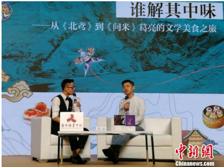
葛亮（右）作客南国书香节

2018南国书香节暨羊城书展10日至14日在广州举办，期间，旅港作家、两届《亚洲周刊》“全球华文十大小说奖”得主葛亮携最新力作《问米》与读者见面，冀望这部小说集给读者带来人性温暖的慰藉。